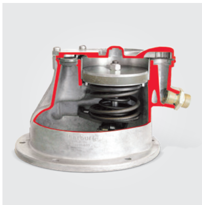
Klasyczna pompa próżniowa tłokowa (model w przekroju)

Dalsza eksploatacja używanej pompy próżniowej w wyremontowanym silniku: Pompy próżniowe są połączone z silnikiem i zostają przyłączone w zależności od wariantu konstrukcyjnego do obiegu oleju silnikowego. Po awarii silnika mogą wystąpić następujące sytuacje: