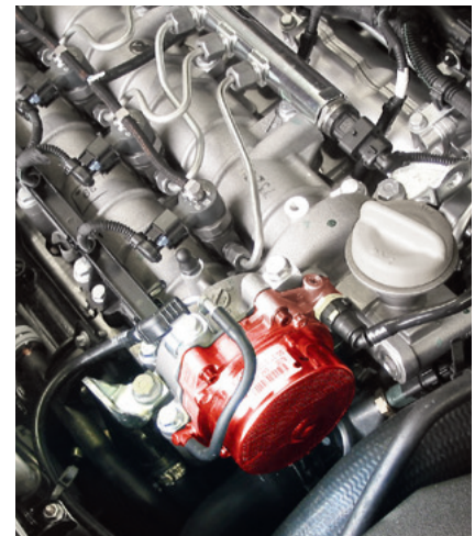
Pompa próżniowa w pojeździe Opel Vectra C (wyróżniona)

Prawo do zmian i odchyłeń rysunków zastrzeżone. Przyprządkowanie i części zastępcze patrz obowiązujące katalogi lub systemy oparte na danych TecAlliance.